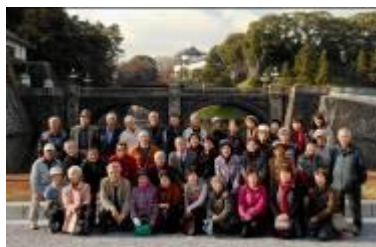
【皇居 二重橋の前にて】

12月11日(水)暖かい日差しの中40名により、NHKスタジオパークを見学し、皇居を散策してきました。NHKスタジオパークでは司会者になりきり、実演してきました。科学技術館では、未来の多彩なテクノロジーを体験し、高齢社会に役に立つロボット等を見ることができました。参加者から車内のバスガイドさんの説明が良かったという感想も頂きました。