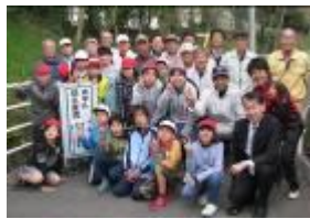
ホタル少年団と里親の皆さん