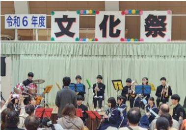
滑川中学校吹奏楽部の皆さん